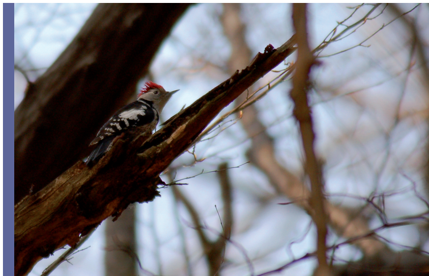
fol. Ł. Kajtoch

Kierunek zmian liczebności dzięcioła średniego w Polsce nie jest znany. Wynika to przede wszystkim z braku długoterminowych badań nad liczebnością gatunku, jak i niskiej frekwencji stwierżeń dzięcioła