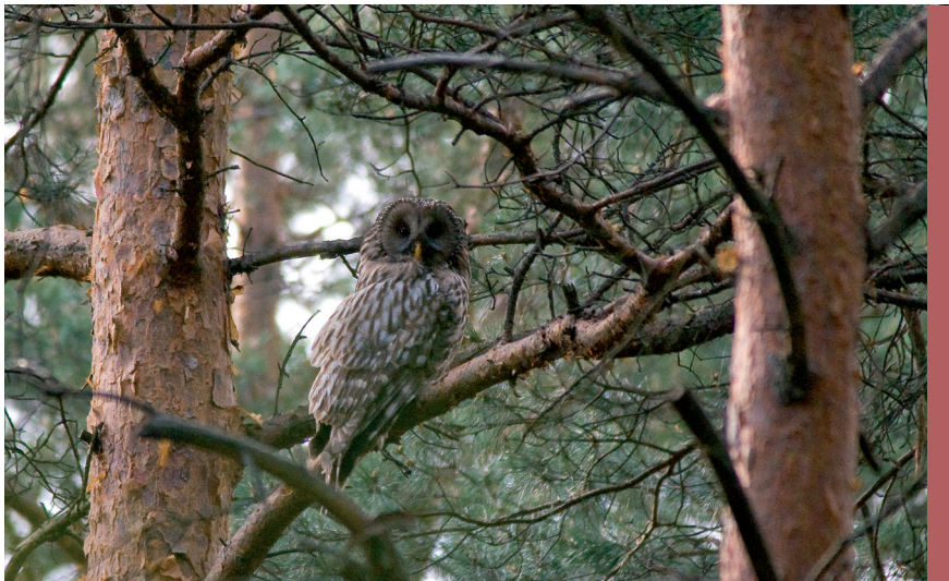
fol. G. Zawadzki