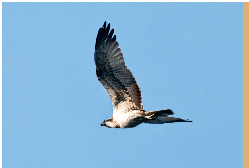
fol. G. Zawadzki

Liczebność rybołowa w Polsce ulegała w ostatnich dziesięcioleciach wyraźnym wahaniom. Szacuje się, że na początku XX w. gniazdowało w kraju ok. 100 par tego gatunku. Później następował sukcesywny spadek liczebności rybołowa, związany zarówno z bezpośrednim prześladowaniem, jak i chemicznym skażeniem środowiska. Minimum, na poziomie 20–30 par, polska populacja osiągnęła w połowie lat 80. XX w. Poprawę stanu populacji odnotowano w drugiej połowie lat 90., kiedy oszacowano ją na ok. 70 par. Następnie miał miejsce kolejny, wyraźny, spadek liczebności i osiągnięcie jej obecnego poziomu (Mizera 2009a). W czasie zmian liczebności areał zasiedlony przez polską populację pozostawał mniej więcej stały i ograniczał się przede wszystkim do Mazur, północnej Wielkopolski z ziemią lubuską i południowego Pomorza (Mizera i in.