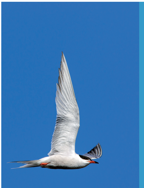
fol. G. Zawadzki

Liczebność rybitwy podlega dość silnym fluktuacjom, głównie w wyniku zmiennych stanów wód w korytach rzek (także zbiornikach zaporowych), oraz niewłaściwej gospodarki wodnej na stawach hodowlanych w okresie lęgowym, zagospodarowania żwirowni, a także ograniczonej do-