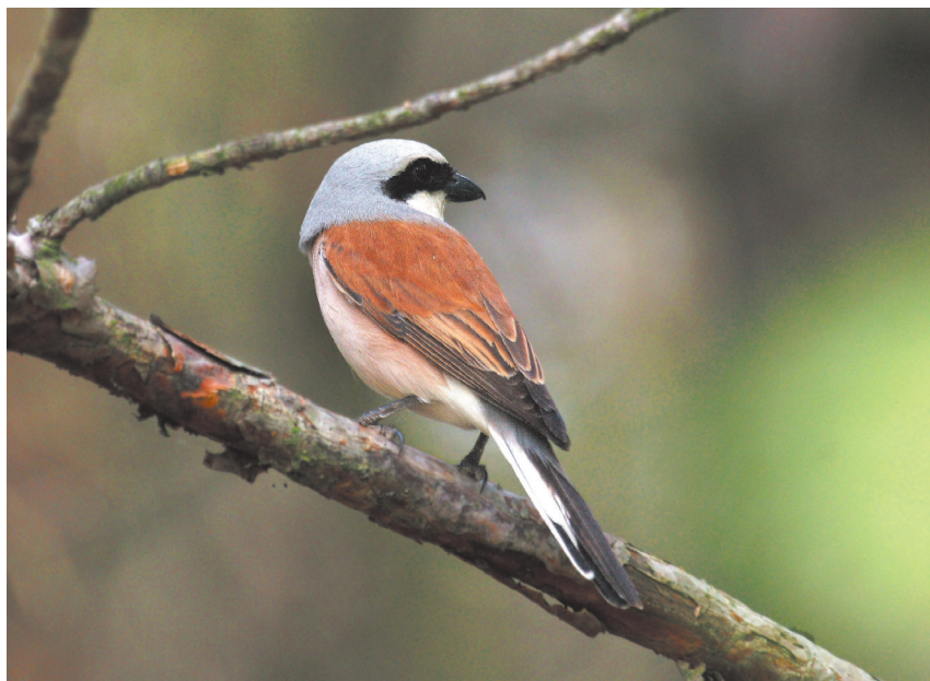
fol. G. Zawadzki

Znaczne wahania liczebności utrudniają ustalenie dokładnego przedziału liczebności i ogólnokrajowego trendu zmian populacyjnych, niemniej wieloletnie badania porównawcze prowadzone na dużych powierzchniach krajobrazowych w różnych regionach kraju wskazują na wzrost liczebności krajowej populacji w ostatnich latach (Kuźniak 2004). Tendencje wzrostowe zaznaczyły się szczególnie wyraźnie we wschodniej części Polski (Dombrowski i Goławski 2002). Natomiast jak wskazują dane zgromadzone w ramach Państwowego Monitoringu Środowiska (Monitoring Pospolitych Ptaków Lęgowych — MPPL), w latach 2000–2006, populacja gąsiorka na terenie kraju wydaje się być stabilna (Chylarecki i Jawińska 2007).